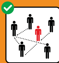
Zur Rückverfol- gung immer vollständige Kontaktdaten angeben.