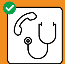
Nur nach telefonischer Anmeldung in Arztpraxis oder Notfallstation.