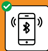
Um Infektions- ketten zu stoppen: SwissCovid App downloaden und aktivieren.