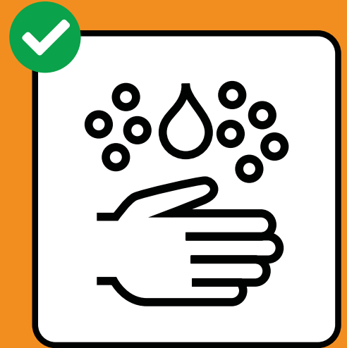
Gründlich Hände waschen.