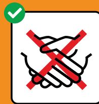
Hände schütteln vermeiden.